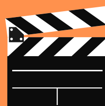
Arte en eventos especiales